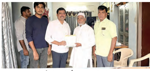
ప్రొద్దుటూరు మే 15 ప్రభాతవార్త

ఎంతో ప్రతిష్ఠాత్మకంగా రాష్ట్ర ప్రభుత్వం ఆలోచిస్తూ భద్రతలో భాగంగా సీఎం సహాయ నిధి ద్వారా అభివృద్ధి కార్యక్రమం చేపట్టిన చెక్కులను టిడిపి మాజీ ఇంచార్జ్ జీ వీర ప్రసాద్ కుమార్ రెడ్డి శుక్రవారం అభివృద్ధి కార్యక్రమం చేపట్టిన చెక్కులను పంపిణీ చేసి నూతన బందడికి శ్రీకారం చుట్టారు. అభివృద్ధి కార్యక్రమం ఇంటి వద్దకే వెళ్లి చెక్కులు పంపిణీ చేయడం ద్వారా బాధితులకు అందగా మే ముఖ్యంగా అంబా భరోసా కల్పిస్తున్నారని ఆనందంలో నందించారు. అలాగే ఆ ప్రాంతంలో ఉన్న సమస్యలపై ప్రజలతో మాట్లాడి ప్రభుత్వ దృష్టికి తీసుకెళ్లి అవకాశం ఉంటుందన్న సందేశంతో ప్రవేశించే చెక్కులను రాష్ట్ర ముఖ్యమంత్రి చంద్రబాబు, మంత్రి లోకేశ్ నందలూరు ప్రజల వద్దకే ప్రభుత్వ సహాయాన్ని తీసుకొని వెళ్లడం వలన పార్టీ మరియు ప్రభుత్వం పట్ల ప్రజల్లో మంచి అభిప్రాయం కలుగుతుందని ఈ సందర్భంగా ఉక్కు ప్రవేశించే రెడ్డి తెలిపారు.